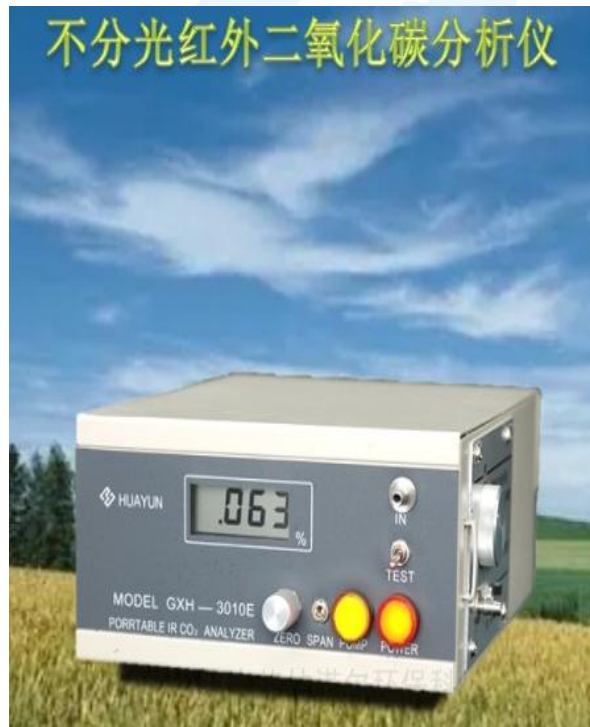
不分光红外二氧化碳分析仪