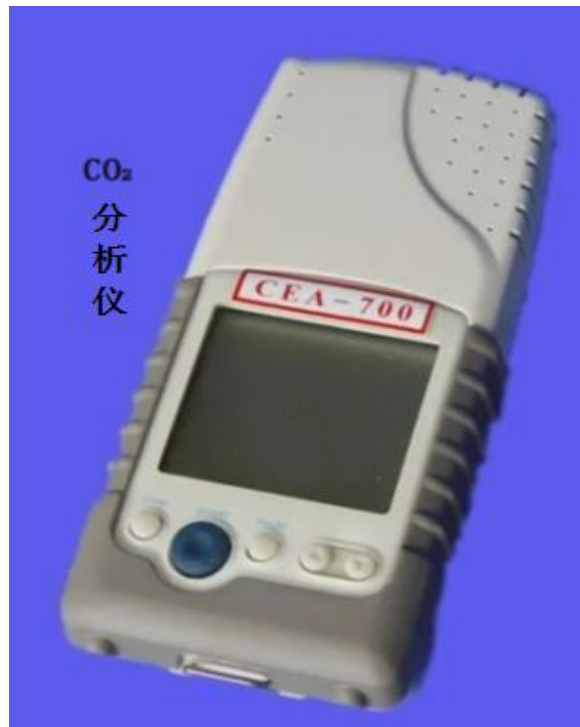
CO 2 分析仪