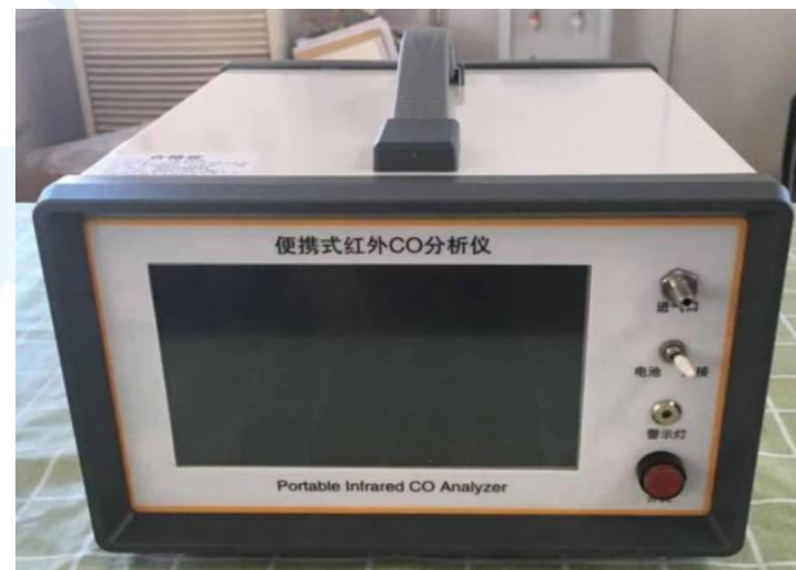
便携式红外CO分析仪